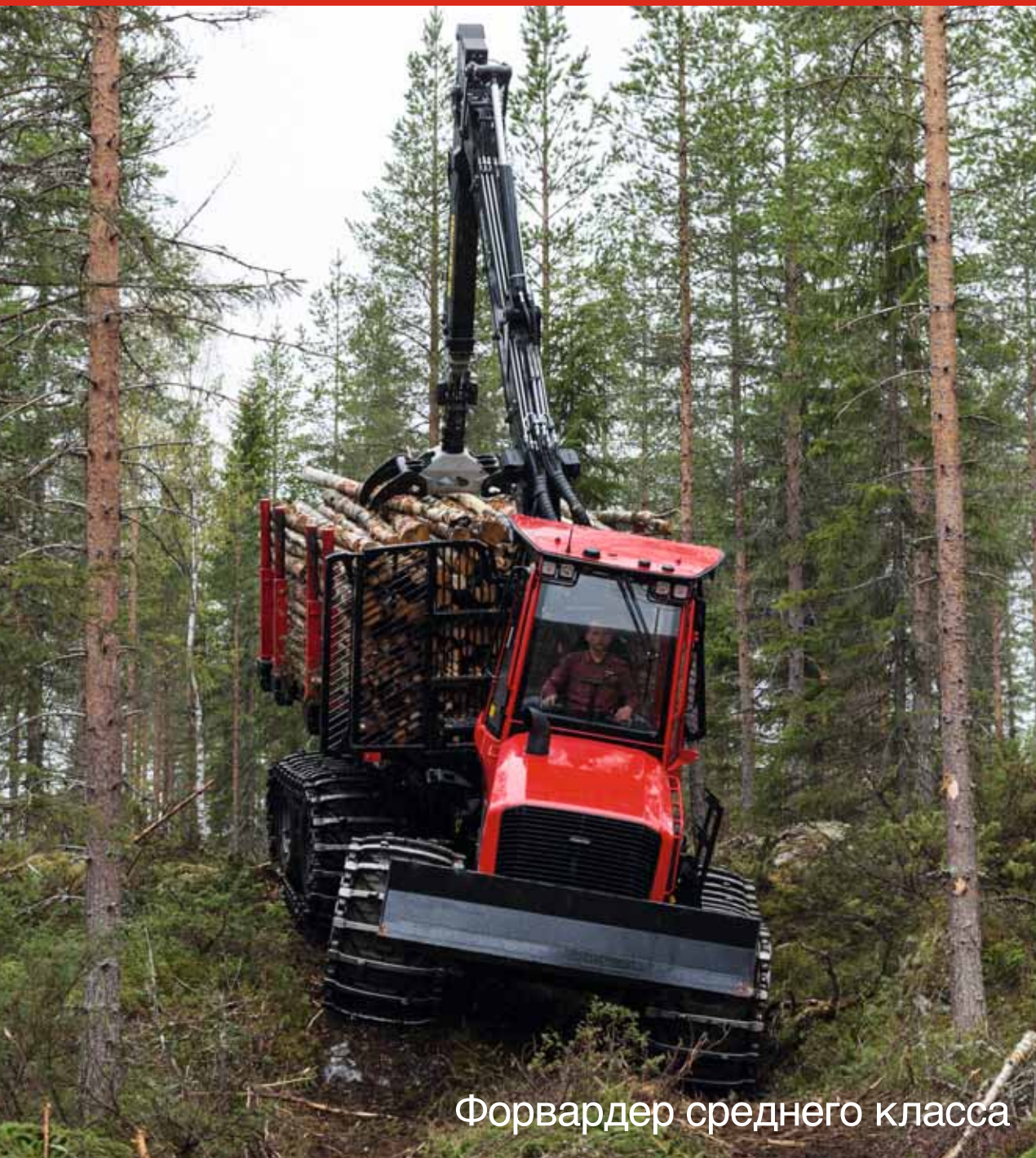
Форвардер среднего класса